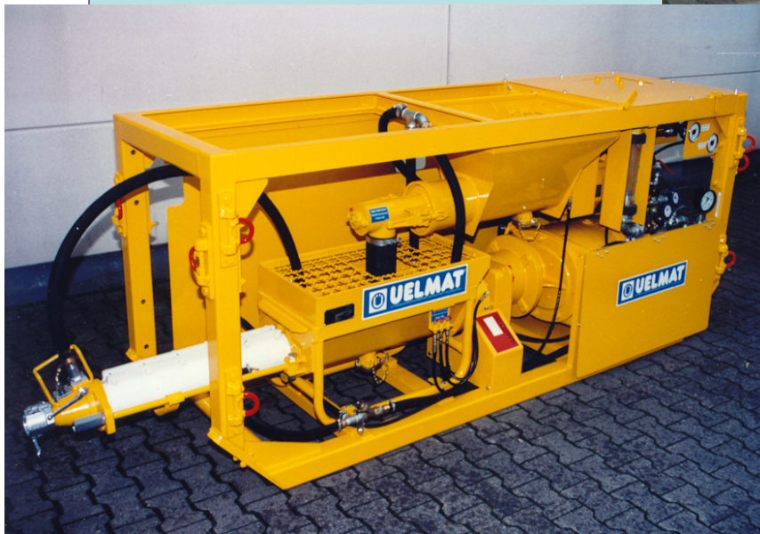
Schaummörtel-Mischpumpe Foam-mortar-mixing-pump UELZENER S35L- SCH