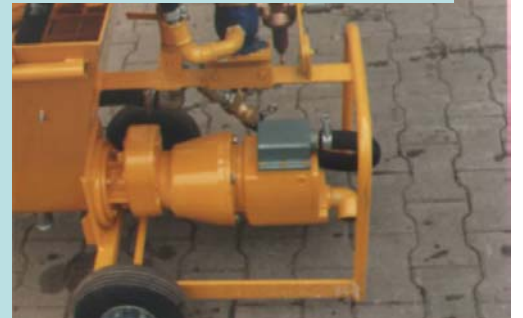
Mörtelpumpe und Tellermischer für Spezialmörtel zum Verankern, Injizieren und Hinterfüllen

Mortar pump with pan mixer for special mortar for anchoring, injection and backfilling