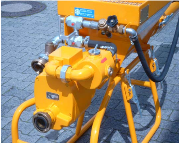
Durchlaufmischer für Bergbaumörtel Continuous mixer for mining mortar ESTROMAT 405-L